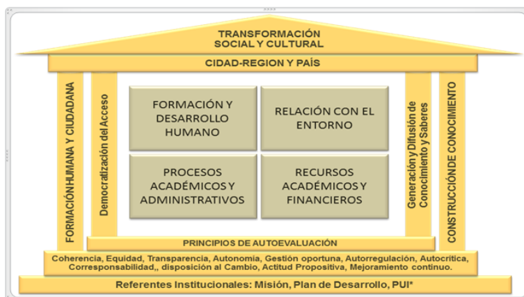
Gráfico 1. Articulación elementos estructurales de la calidad en la Universidad Distrital